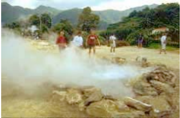
Schwefelquellen in Furnas