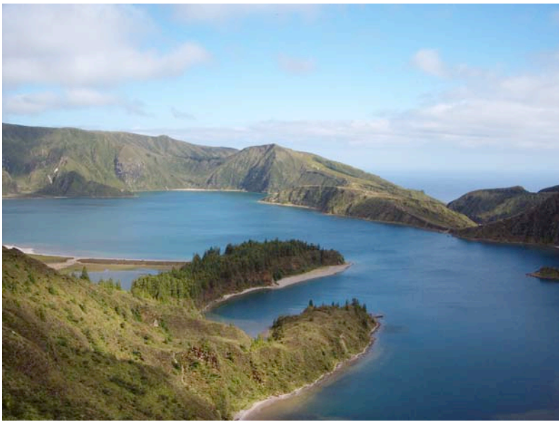
Bergsee Lago de Fogo