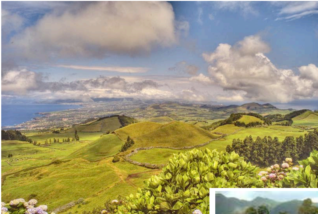
Blick über die Insel vom Kraterrand