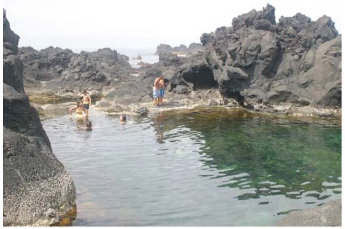
Naturschwimmbecken von Mosteiros