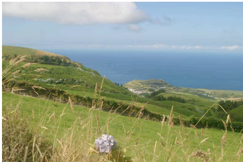
Blick vom Kraterwanderweg