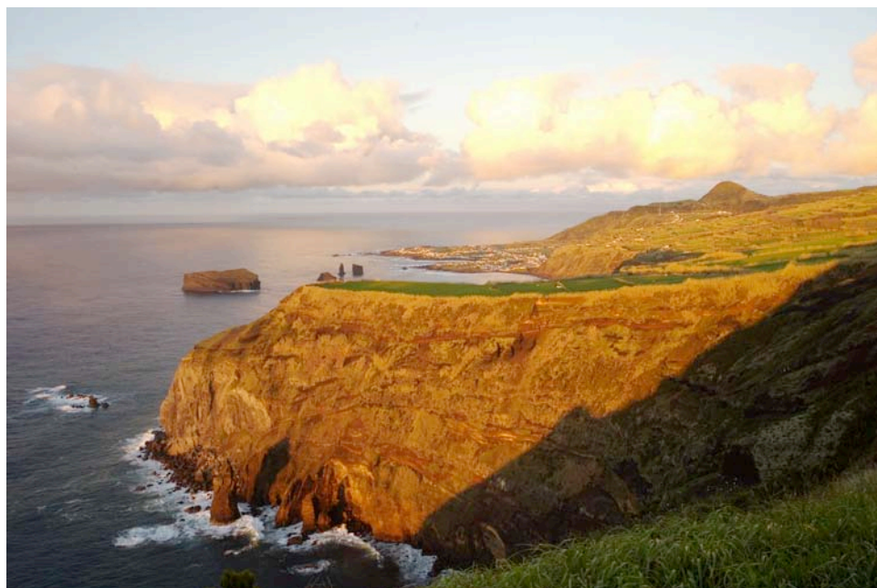
Küstenlandschaft von Mosteiros