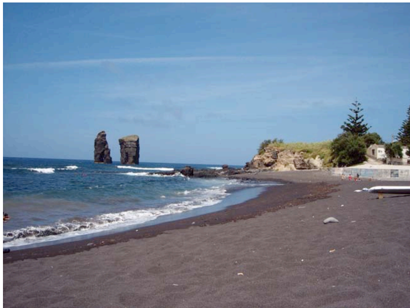
Sandstrand von Mosteiros